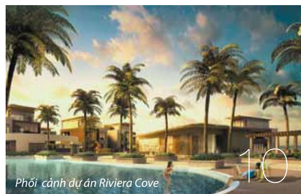
Phối cảnh dự án Riviera Cove