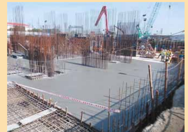
Toàn cảnh tiến độ xây dựng tại Công trình dự án Riviera Point

Lối vào cạnh số 582 Huỳnh Tấn Phát, Quận 7, Tp. Hồ Chí Minh Tel: (848) 377 38 777 Fax: (848) 377 34 292 Email: rp@keppeland.com.vn - www.rivierapoint.com.vn